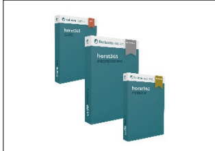
Bild 2: Die gestaffelten Paketen horst365 Basic, horst365 Professional und horst365 Premium sind genau auf die unterschiedlichen Anforderungen der Nutzer abgestimmt.